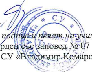
ГРАФИК за провеждане на допълнителен час на класа I учебен срок, учебна 2023/2024 година

на директора на СУ «Владимир Комаров», гр. Велико Търново.